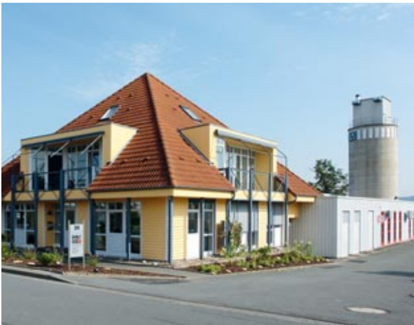
Unser Firmensitz in Lage/Westfalen

Bei uns ist Ihr Mehrwert in besten Händen.